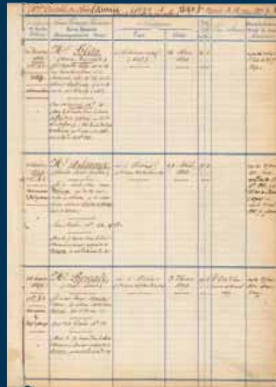
Registre de contrôle des élèves du Conservatoire 1849-1855. AJ/37/353/2.

Métro ligne 13, station Saint-Denis-Université