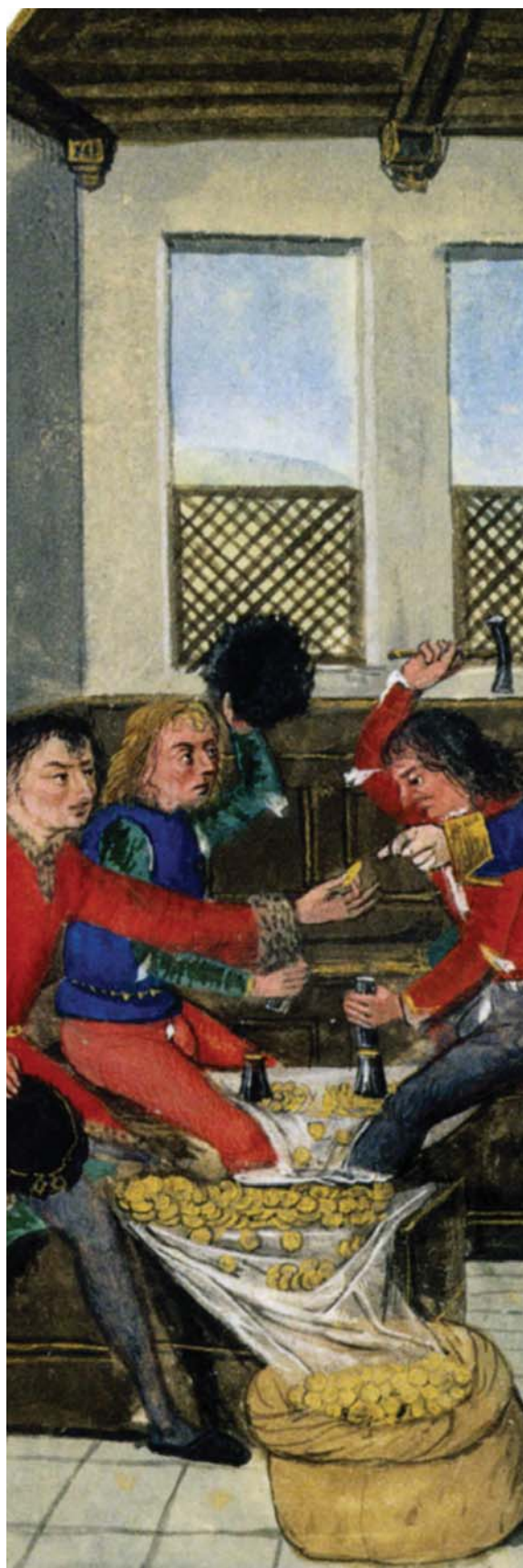
Illustration : frappe de la monnaie dans le Traité des Monnaies de Nicole Oresme, entre 1480 et 1490, Bruges, BNF Mss fr 23927 f° 5