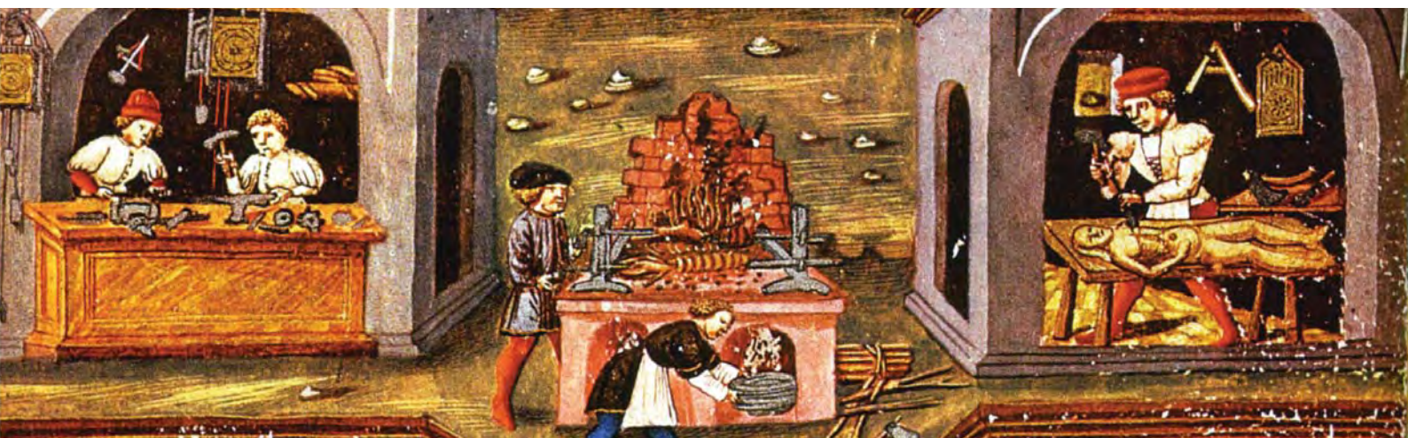
Illustration : extrait de De Sphaera , Bibliothèque Estense, Modène, Ms Lat. 209 o 11 o , XV e siècle ?