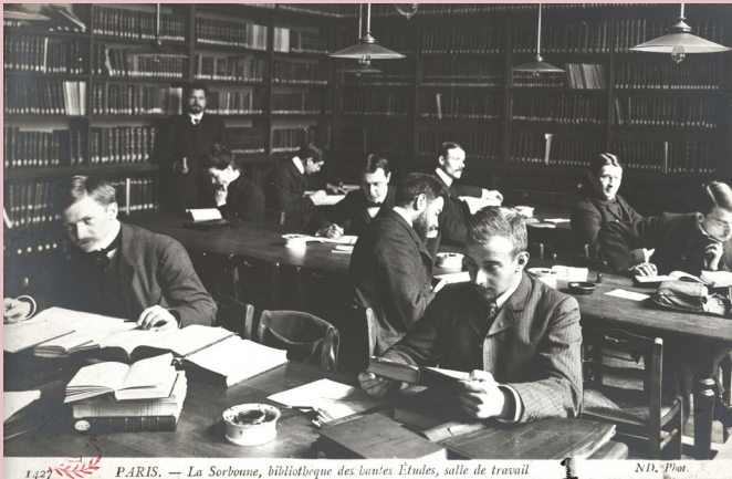
1427 PARIS. — La Sorbonne, bibliothèque des hautes Études, salle de travail N.D. Plus...

L'école : transmettre et façonner le savoir