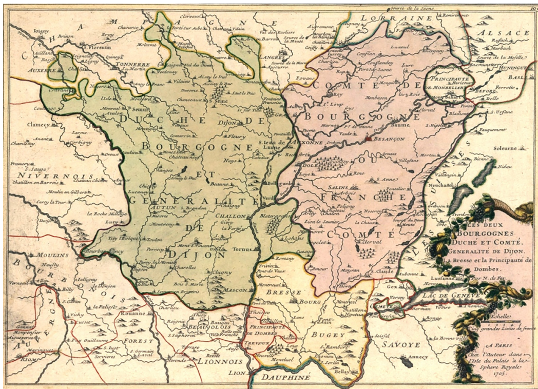
Illustration : Carte des deux Bourgognes de Nicolas de Fer, Les deux Bourgognes. Duché et Comté. Généralité de Dijon... , Paris, 1705.

sous la direction de Sylvie Laigneau-Fontaine actes des journées de présentation tenues à la salle de l'Académie des sciences, arts et belles-lettres de Dijon, les 28 et 29 janvier 2025